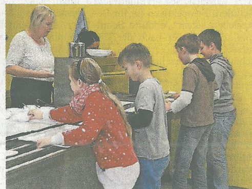
Mit dem Essen in der Mensa gelingt der Übergang von Schultag zum offenen Nachmittagsangebot.