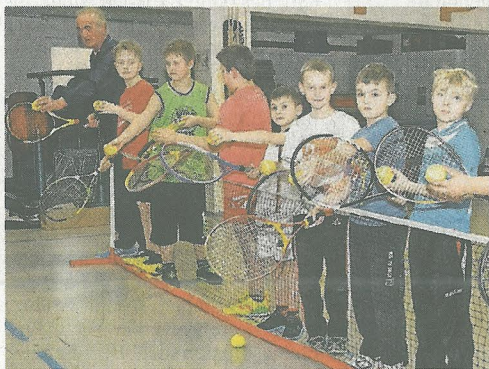
Tennis ist eines der sportlichen Angebote für den Nachmittag in der Ganzttagsschule.