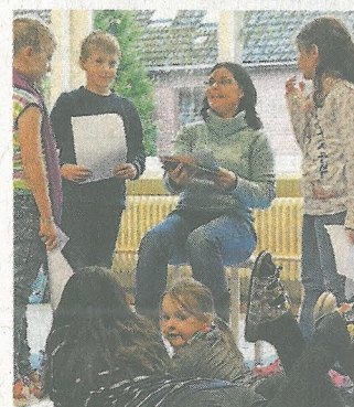
Die Theater-Gruppe führt am Ende des Halbjahres ihr Stück auf.

dem politischen Beschluss, das große Betreuungspaket als Pilotprojekt zuerst im Kernstadtbereich anzubieten. Wegen der zusätzlichen Koordinierungsanforderungen mit dem Hort und für den Abschluss von Verträgen mit Kooperationspartnern wurde bei der Stadt bereits eine neue Stelle eingerichtet.